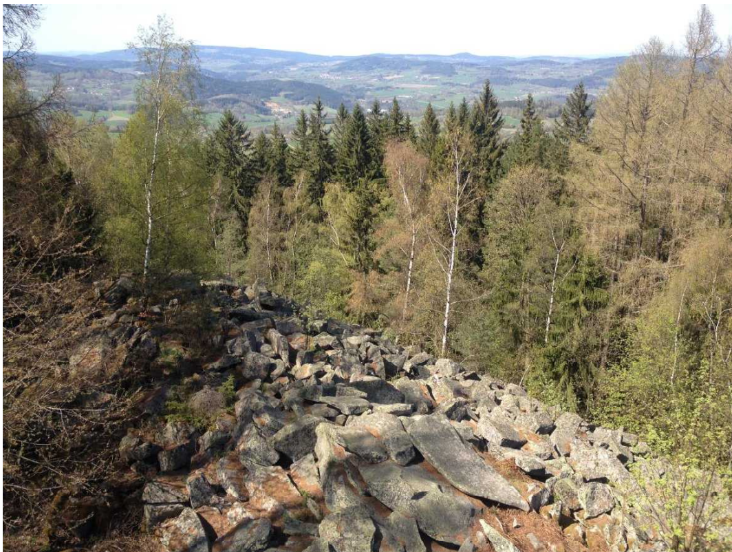
Celkový pohled na balvanité moře