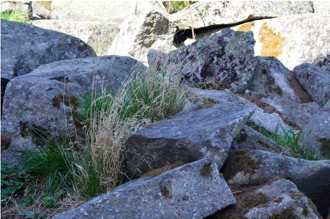
Detail balvanitého moře