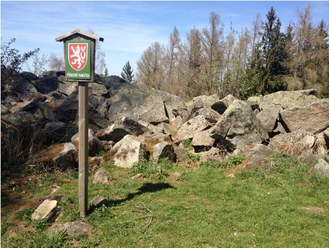
Okraj území s hraničnίκem u rozhledny