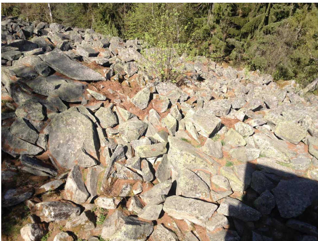
Detail balvanitého moře