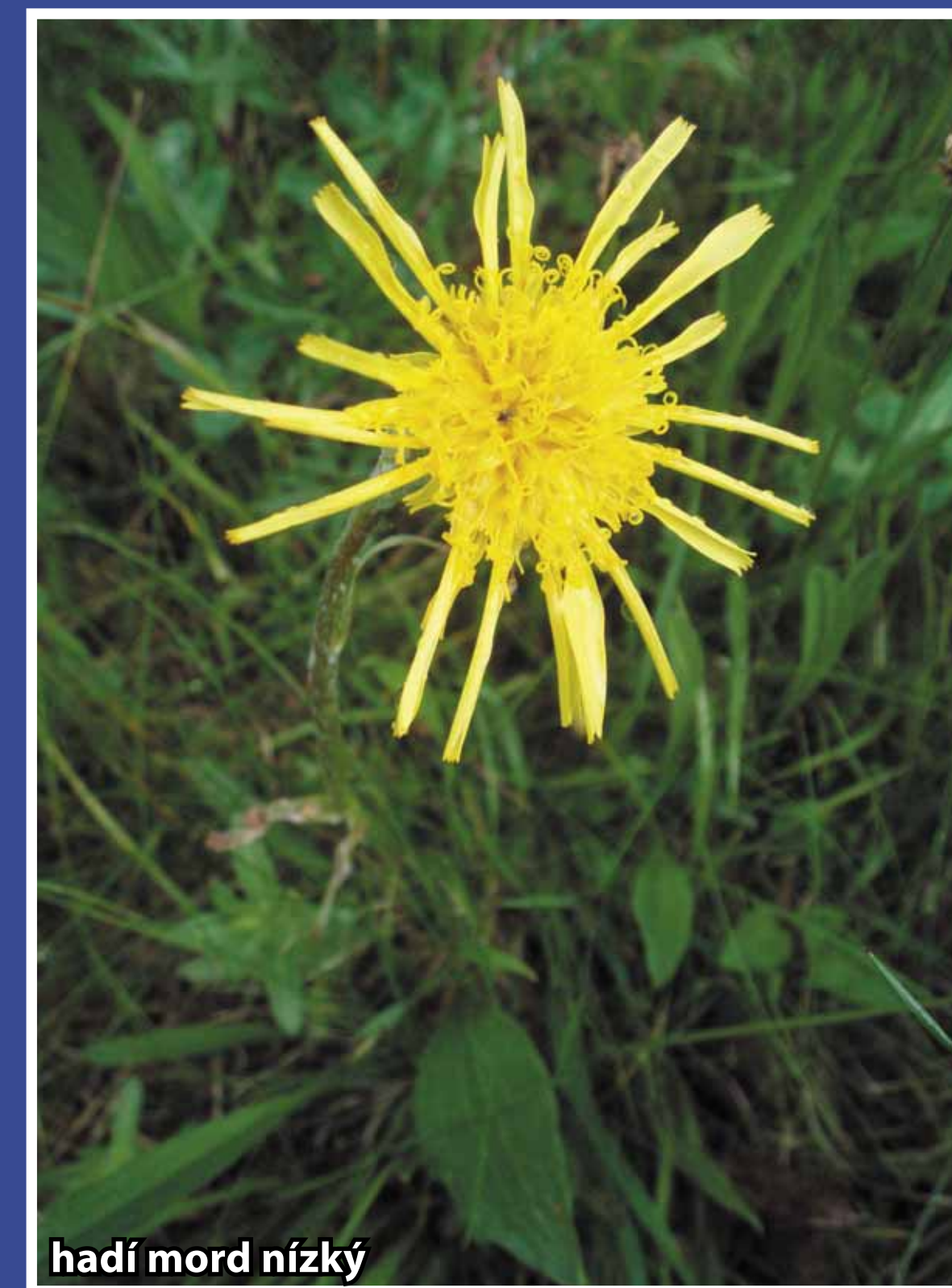
hadí mord nízký

Zbytek vršoviště v mozaice se smilkovým trávníkem se zachoval na balvanitém severozápadním a západním úbočí vrchu Výhon. Dominantu druhově chudého bylinného patra tvoří brusnice borůvka ( Vaccinium myrtillus ), opadavý keřík plodící všeobecně známé černé borůvky, vřes obecný ( Calluna vulgaris ), nízký stále zelený keřík s jehlicovitými listy a od druhé poloviny léta s drobnými světle fialovými květy, a tráva metlička křivolaká ( Avenella flexuosa ) se štětinovitými listy, křivolakou osou i větvíčkami řídkého květenství se nese stříbřitě lesklými klásky. Z keřů se kromě jalovce hojně uplatňuje krušina olšová ( Frangula alnus ), listnatý keř s krátce řapíkatými listy a nenápadnými zelenavými květy ve skupinách v úžlabí listů, z nichž se později vyvinou drobné černé peckovice. Sušená kůra se používá ve farmacii. Jelikož krušina vykazuje velké konkurenční schopnosti a mohla by zdejší bezlesou plochu zarůst, bývá z exponovaných míst občas vyřezávána. Ze vzácnějších rostlin se v borovém lese na severním svahu jedi- něle vyskytuje hadí mord nízký ( Scorzonera humilis ), hvězdicovitá rostlina s bledě žlutým úbořem