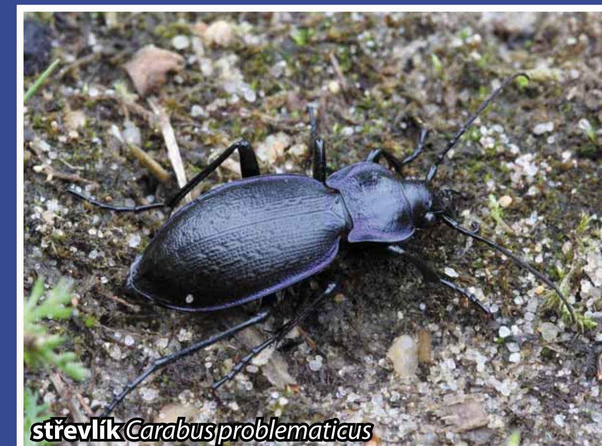
stěvlík Carabus problematicus

Na území přírodní památky žijí dva zvláště chráněné druhy stěvlíků, a to černě zbarvený stěvlík polní ( Carabus arvensis ) a stěvlík ( Carabus problematicus ), podobný černý brouk, ale s nápadným modrým kovovým leskem, který patří na Novobystřicku k typickým lesním druhům. Velcí stěvlíci rodu Carabus mírného podnebného pásu jsou nelétaví, protože mají